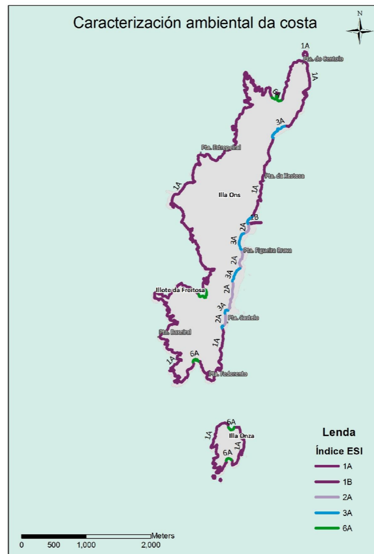
Mapa 1 Caracterización ambiental da costa de Ons